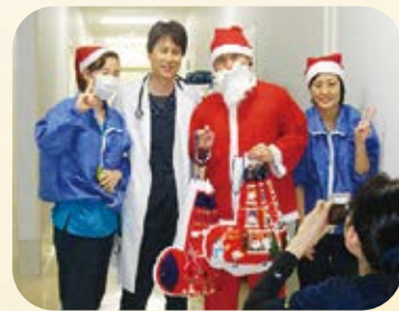
クリスマスイベント (病室訪問)