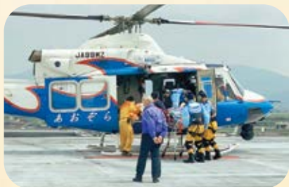
ドクターヘリでの搬送