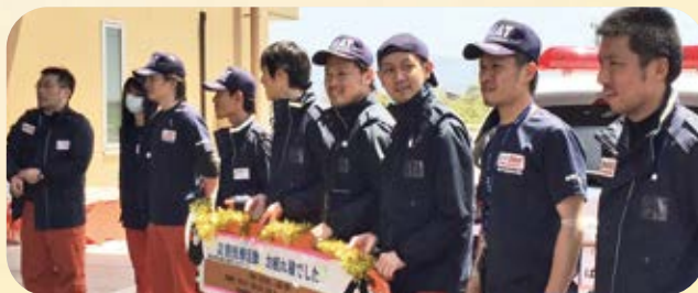
熊本地震DMAT活動からの帰還