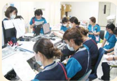
病棟カンファレンス